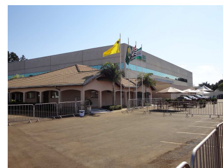
Imagens externas da 12ª Agronegócios Copercana