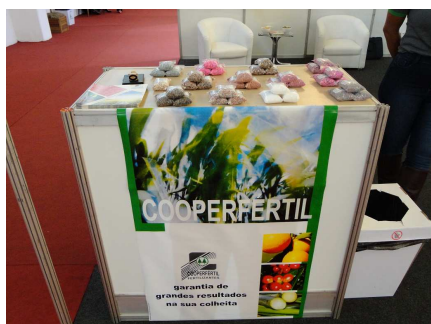
Amostra de produtos e folders Cooperfértil.

Durante os 04 dias do evento, tivemos oportunidade de receber em nosso estande cooperados e produtores, interessados em conhecer e buscar informações de nossa linha de fertilizantes (convencional e Kimco-at), oportunidade em que distribuimos amostras de fertilizantes e folders técnicos da Cooperfértil.