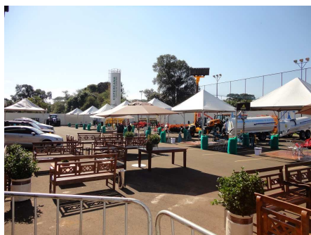
Imagens externas da 12ª Agronegócios Copercana