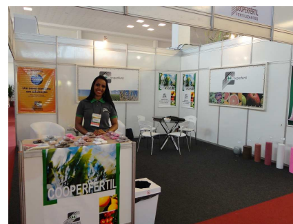
Estande Cooperfértil 2016.